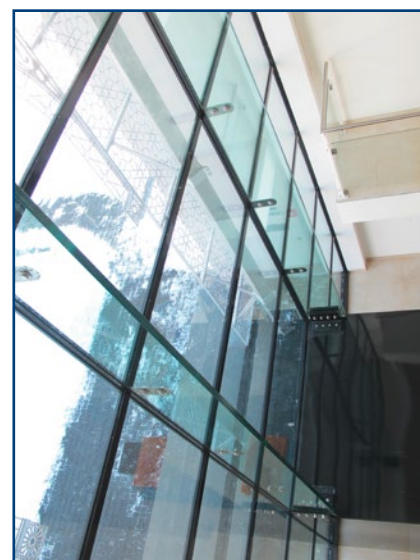
Ausführungsbeispiel: Moschee, Zürich Volketswil